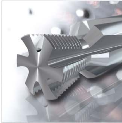
Kegel-Außen-Gewindefräser Conical external thread milling cutter