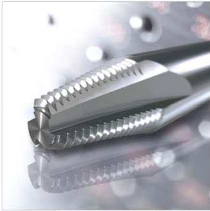
Kegel-Innen-Gewindefräser Conical inner thread milling cutter