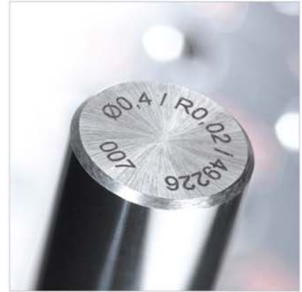
Reproduzierbarkeit durch Protokollierung und Ident-Nr. Reproducibility thanks to recording and life cycle no.