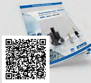
Varia Katalog / Catalogue

The change system for safe and quick setup!