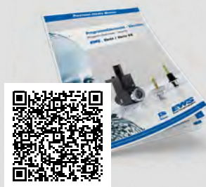
Varia Katalog / Catalogue

The change system for safe and quick setup!